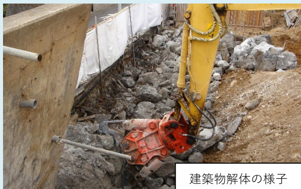
建築物解体の様子

建設作業の振動苦情では、騒音苦情と同様に迅速な対応をするとともに、振動を発生させる機材を長時間連続して使用しないなど、近隣に配慮した作業をするよう事業者へ指導しています。