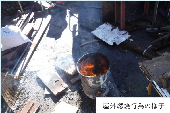
屋外燃焼行為の様子

屋外燃焼（野焼き）は原則禁止となっていますが、例外的に制限がかからない行為もあります。そのような行為であっても、市に相談が寄せられた際は、現地調査の上、焼却物を十分に乾燥させる、風向きに注意するなど行為者に配慮要請を行っています。